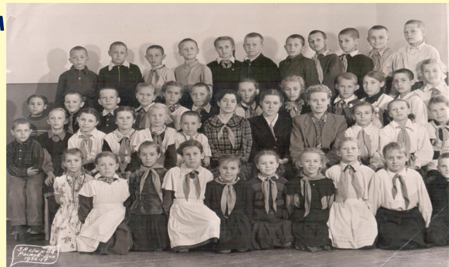
1957 г., учащиеся 3 «А» класса сш. №84 с учителем класса, старшей пионерской вожатой школы и пионерской вожатой класса.