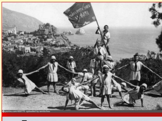
Пионеры из пионерского лагеря «Артек». 1926 г.