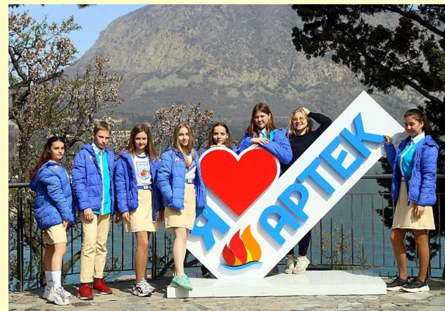
«Артек» в наше время