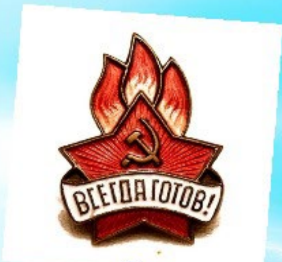
Пионерский значок 50-х годов XX века