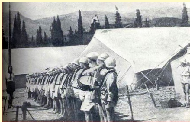
Пионерская линейка в «Артеке». 1925 г.