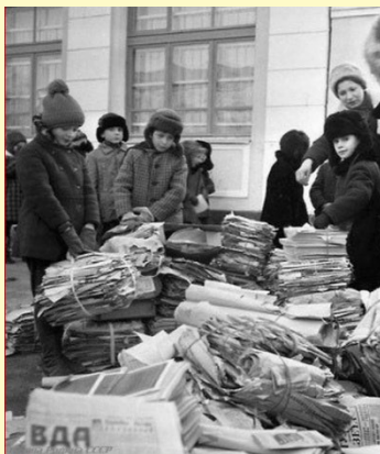
Сбор макулатуры пионерами