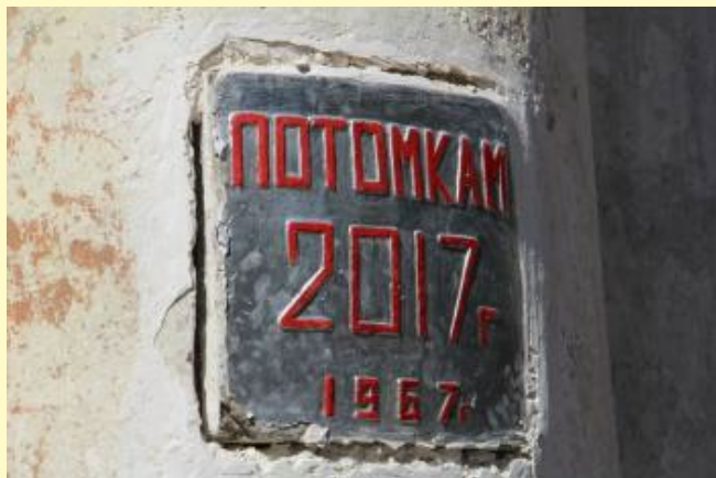
Фото: твойгород.com. © «Капсулу времени» вскрыли в Ростове. Послание хранилось 50 лет.