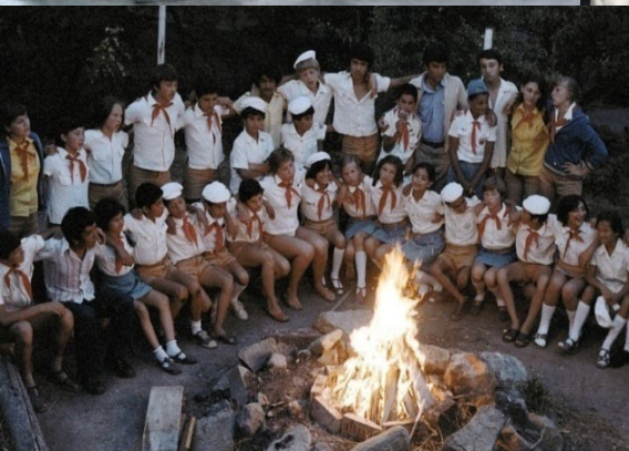
Пионеры у костра, 1981 г.